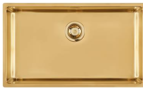
Lavello KE Gold 2157 859